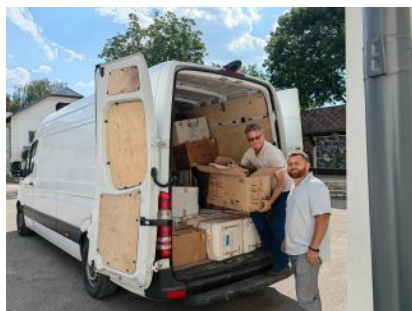
Transport z darami do Kamieńca Podolskiego

Gmina Kolbuszowa nie przestaje pomagać ogarniętej wojną Ukrainie. Kolejny transport z darami dotarł 22 sierpnia br. do Kamieńca Podolskiego w Ukrainie.