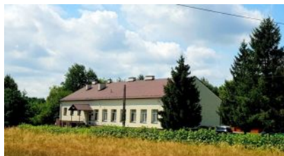
Rekrutacja do ośrodka wsparcia - Dzienny Dom „SENIOR+” w Hucie Przedborskiej

Dzienny Dom „SENIOR+” w Hucie Przedborskiej jako ośrodek wsparcia funkcjonujący przy Miejsko - Gminnym Ośrodku Pomocy Społecznej w Kolbuszowej zaprasza mieszkańców Gminy Kolbuszowa, nieaktywnych zawodowo, którzy ukończyli 60 lat do udziału w zajęciach.