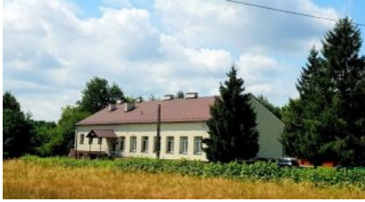
Rekrutacja do Dziennego Domu „SENIOR+” w Hucie Przedborskiej