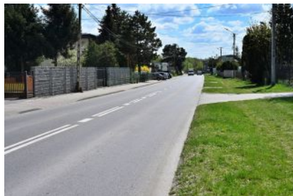
Podpisanie umowy na budowę ścieżki pieszo-rowerowej

W dniu 9 kwietnia Burmistrz Kolbuszowej Grzegorz Romaniuk podpisał umowę z wykonawcą na realizację zadania pn. „Przebudowa drogi gminnej nr 150505R w miejscowościach Kolbuszowa i Kolbuszowa Górna – od km 1+210 do km 2+510 wraz z niezbędną infrastrukturą i urządzeniami budowlanymi”.