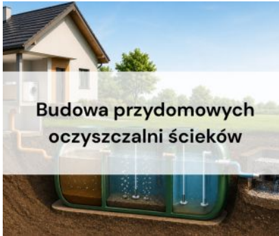
Budowa przydomowych oczyszczalni ścieków w Gminie Kolbuszowa

Gmina Kolbuszowa realizuje projekt pn. „Ochrona obszarów cennych przyrodniczo poprzez budowę przydomowych oczyszczalni ścieków na terenie gminy Kolbuszowa”. Przedsięwzięcie realizowane jest w formule projektu parasolowego z udziałem mieszkańców gminy. Jego głównym celem jest poprawa stanu środowiska naturalnego oraz jakości życia mieszkańców poprzez ograniczenie negatywnego wpływu ścieków na wody powierzchniowe i podziemne, gleby oraz lokalne ekosystemy.