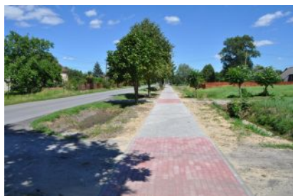
Budowa chodnika w Kupnie