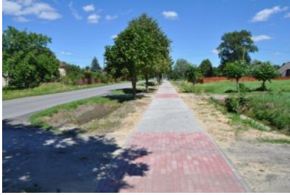
Budowa chodnika w Kupnie