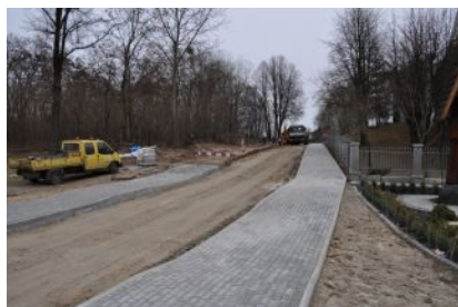
Budowa chodnika w miejscowości Kupno