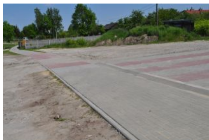
Budowa chodnika w miejscowości Kupno