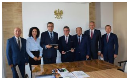
Podpisanie umowy o dofinansowanie projektu