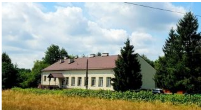
„SENIOR+” w Hucie Przedborskiej

Rekrutacja do ośrodka wsparcia - Dzienny Dom