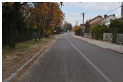
Porządkowanie gospodarki wodno-ściekowej