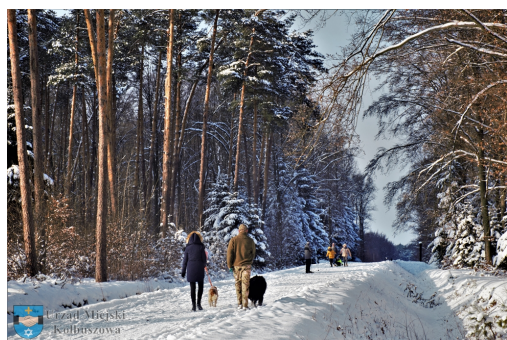
Ścieżka przyrodnicza Białkówka i stawy w Weryni