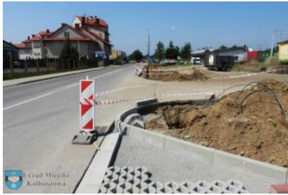
ul. ks. Ruczki w Kolbuszowej

Trwają prace przy ul. ks. Ruczki w Kolbuszowej. Inwestycja realizowana jest w ramach projektu „Budowa Podmiejskiej Kolei Aglomeracyjnej- PKA: Budowa i modernizacja linii kolejowych oraz infrastruktury przystankowej” i obejmuje trzy zadania.