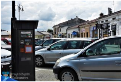
Strefa Płatnego Parkowania

W Strefie Płatnego Parkowania przy ul. Plac Wolności w obrębie kolbuszowskiego rynku zamontowano dodatkowy (czwarty) parkomat. Urządzenie zostało ustawione w zachodniej pierzei rynku (górnym parkingu).