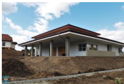
Dzienny Dom Seniora w Kolbuszowej

Do końca roku mają potrwać prace przy budowie Dziennego Domu Seniora w Kolbuszowej, które rozpoczęły się w maju ubiegłego roku. Obiekt powstaje w pobliżu kościoła pw. Wszystkich Świętych przy ul. Narutowicza. Rozpoczęcie działalności Domu Seniora zaplanowane jest na początek 2022 roku. Głównym celem ośrodka będzie aktywizowanie społeczne grupy trzydziestu seniorów powyżej 60 roku życia oraz zapewnienie im odpowiednich warunków opieki.