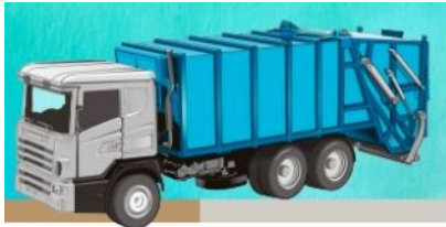
Analiza systemu gospodarki odpadami komunalnymi

Zmiana opłaty za odbiór odpadów na terenie Gminy Kolbuszowa jest nieunikniona. Przeprowadzona analiza systemu gospodarki odpadami komunalnymi w naszej Gminie wykazała, że pobierane na obecnym poziomie opłaty tj. 23 zł/osoby i 20 zł/osoby (w przypadku kompostowania BIO odpadów) nie pozwalają na realne pokrycie kosztów związanych z odbiorem, transportem i zagospodarowaniem odpadów odebranych bezpośrednio od mieszkańców, jak i za pośrednictwem Punktu Selektywnej Zbiórki Odpadów Komunalnych przy ul. Piłsudskiego 111 A.