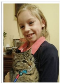
Schorzenie - padaczka lekooporna

Za jej pięknym uśmiechem kryje się wojowniczką, która walczy o swoją przyszłość.