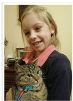
Schorzenie - padaczka lekooporna

Za jej pięknym uśmiechem kryje się wojowniczką, która walczy o swoją przyszłość.