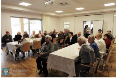
Otwarcie Dziennego Domu Pobytu Seniora

W dniu 11 kwietnia br. rozpoczął działalność Dzienny Dom Pobytu Seniora przy ul. Narutowicza w Kolbuszowej. Obiekt został stworzony z myślą o osobach starszych potrzebujących wsparcia w codziennym funkcjonowaniu.