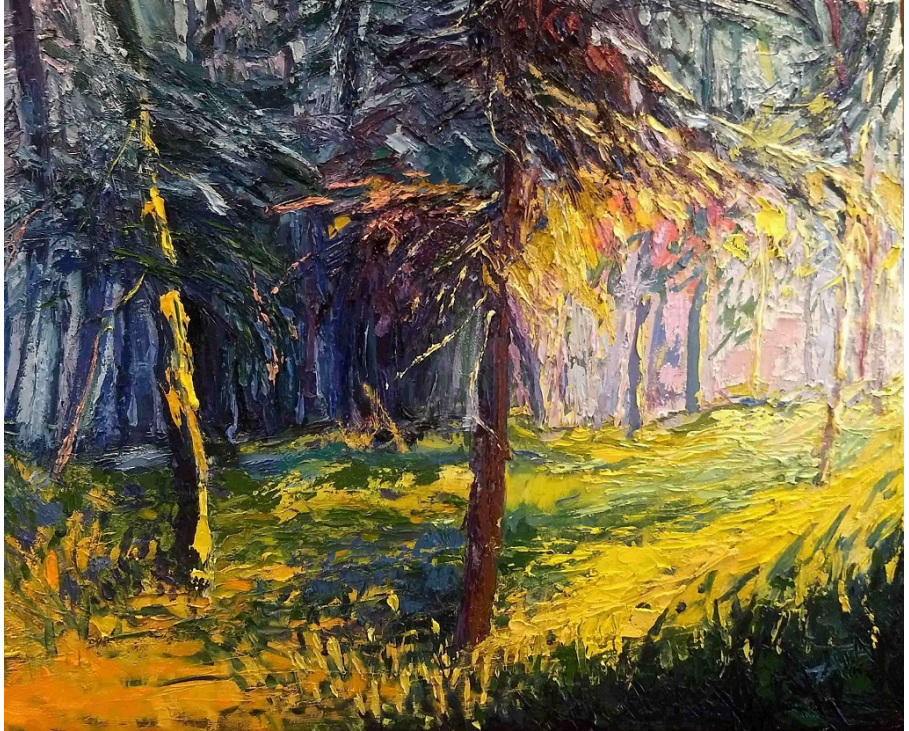
Tancząc w lesie (olej na płótnie) [Dancing Forrest 30 x 24 oil on canvas 2019]