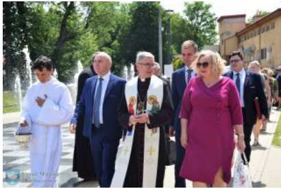
Uroczyste otwarcie bulwarów nad Nilem

W niedzielę, 19 czerwca miało miejsce uroczyste otwarcie Bulwarów nad Nilem im. bł. ks. kard. Stefana Wyszyńskiego, Dziennego Domu Pobytu Seniora i Domu Wsparcia Rodziny.