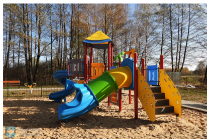
Nowe place zabaw i siłownie plenerowe

W czterech sołectwach Gminy Kolbuszowa zbudowane zostały nowe place zabaw oraz siłownie plenerowe. W Weryni, Przedborzu, Kupnie i Porębach Kupieńskich dzieci mogą już korzystać z urządzeń do zabawy, m.in. zjeżdżalni, huśtawek, wspinaczek, karuzeli czy sprężynowców. Natomiast młodzież i dorośli mają do dyspozycji profesjonalne sprzęty do ćwiczeń siłowych.