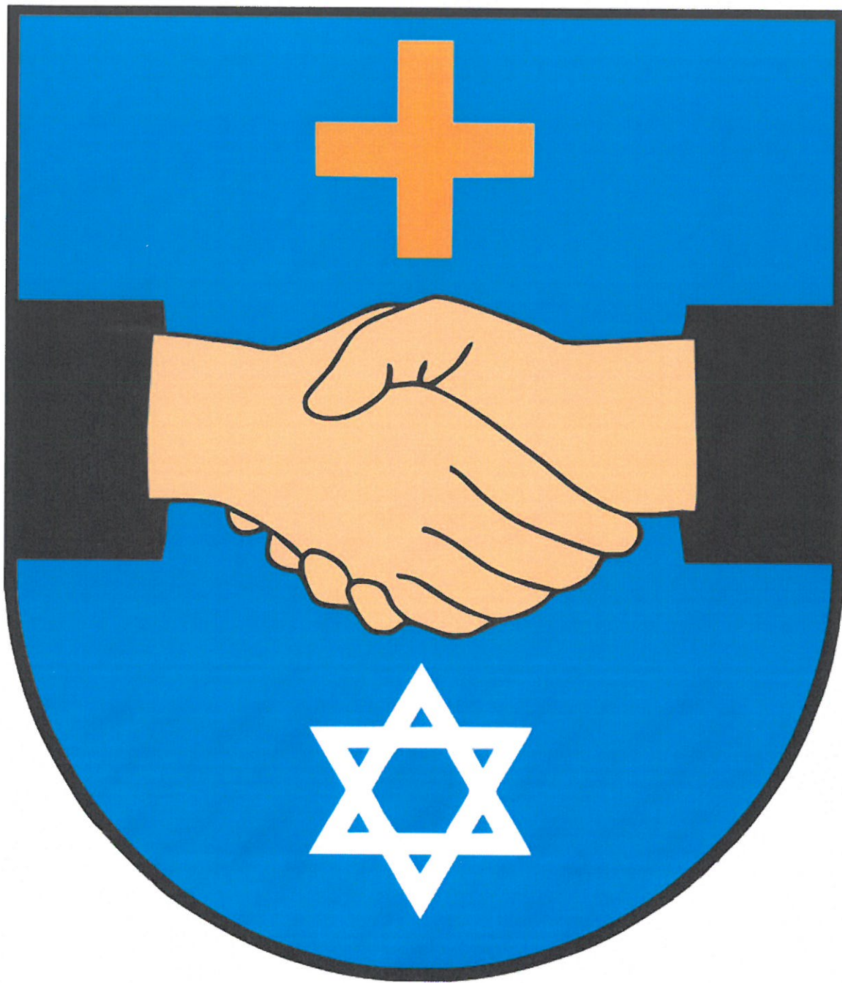
Wzór Herbu Gminy Kolbuszowa